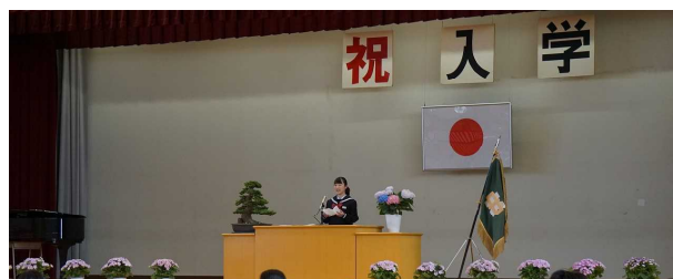
新入生代表の「誓いの言葉」