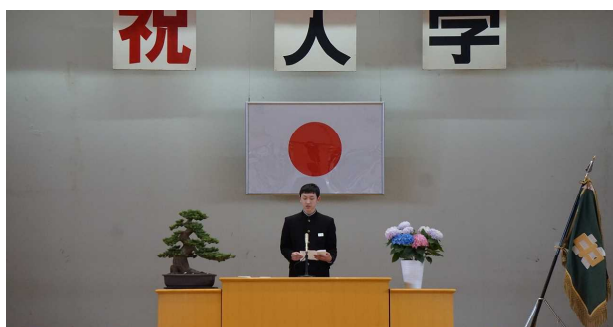
生徒会長の「歓迎の言葉」